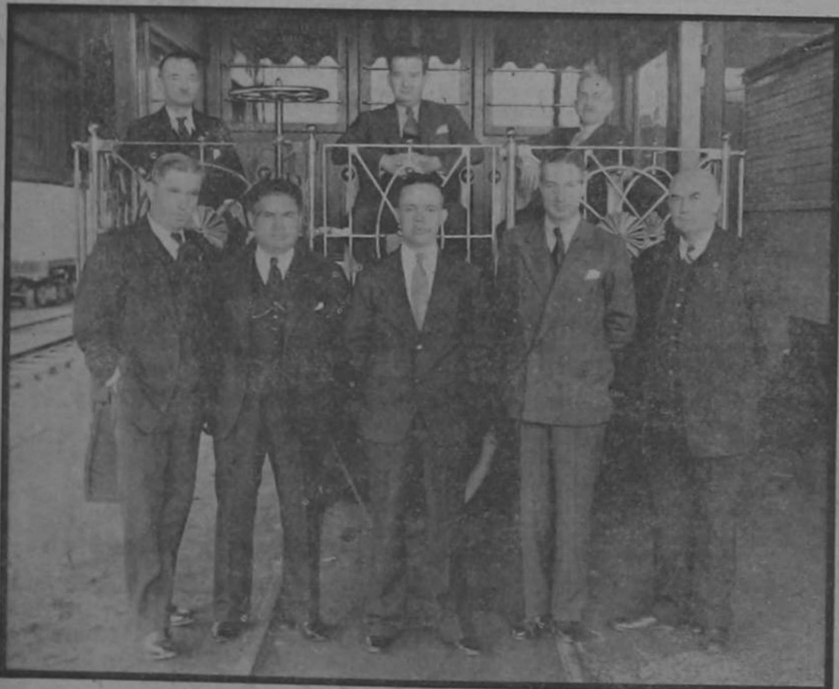
Administrador general y jefes departamentales del Ferrocarril Eléctrico al Pacífico

Muy Felices Pascuas y Próspero Año Nuevo